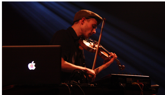
Sur scène pour les trois ans de l'Autre Canal

Je pense que oui, après je ne peux pas savoir ce qui dû au Printemps de