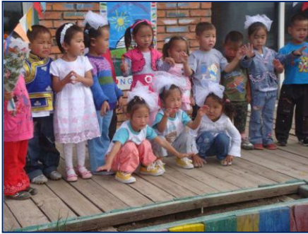
Les enfants déguisés

En 2010, de nombreux évènements, fêtes et excursions ont été organisés pour les enfants.