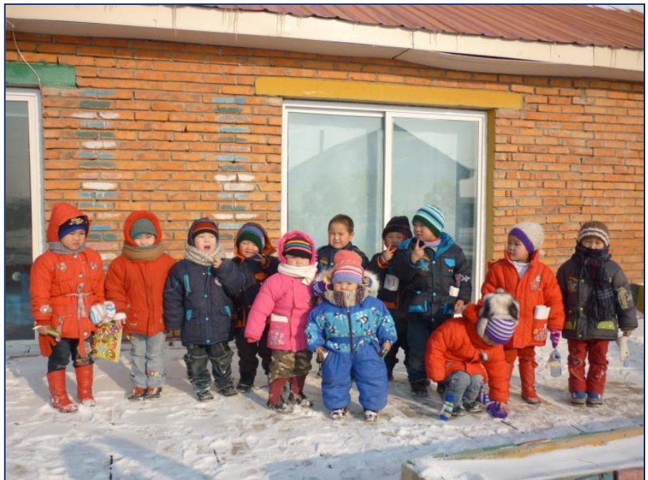
Les enfants devant la maternelle