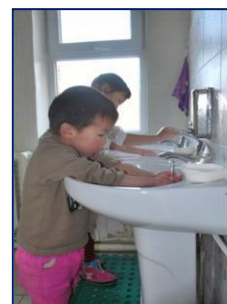
L'importance de se laver les mains

Ils ont tous besoin d'acquérir de bons réflexes en matière d'hygiène. Les professeurs insistent sur l'importance de se laver les mains avant et après les repas, sur comment utiliser les toilettes et se laver les mains après et aussi, sur comment se laver les dents.