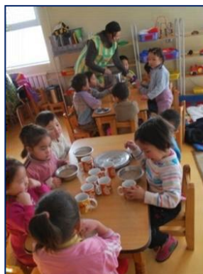
Dans le réfectoire

Des repas sont donnés aux enfants, le matin, le midi et au goûter. Les aliments sont variés afin de s'assurer que tous les besoins nutritifs sont couverts. Il s'agit des carbohydrates, protéines, matières grasses, vitamines et minéraux, eau. Les enfants doivent grandir et être en bonne santé. La nourriture est préparée et servie par l'équipe de cuisiniers du village de yourtes.