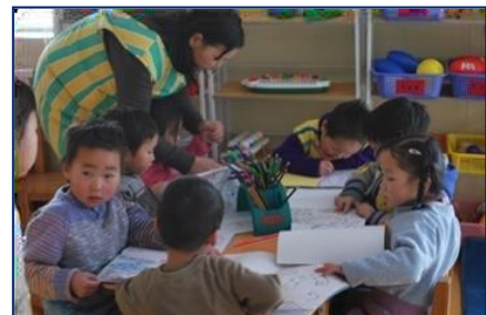
Dans la classe