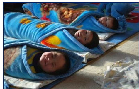
A l’heure de la sieste

En 2010, de nombreux enfants ont eu la chance d’être accueilli à la maternelle. Leur situation était terrible. Un garçon a été abandonné par ses parents à la décharge à ordures. Un autre a été trouvé gravement brûlé dans la yourte familiale, alors que sa mère ramassait des ordures à la décharge. Ils sont maintenant en sécurité et en bonne santé. D’autres ont des parents alcooliques ou en prison.