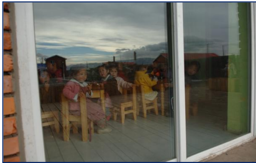
Vue de l'extérieur

Ce programme offre un enseignement maternelle aux enfants pour préparer leur entrée à l'école primaire. Ils viennent de familles très pauvres et vivant dans des conditions de précarité extrêmes. Nous leur donnons des vêtements, de la nourriture et un accès aux soins de santé. La maternelle partie du programme du village de yourtes.