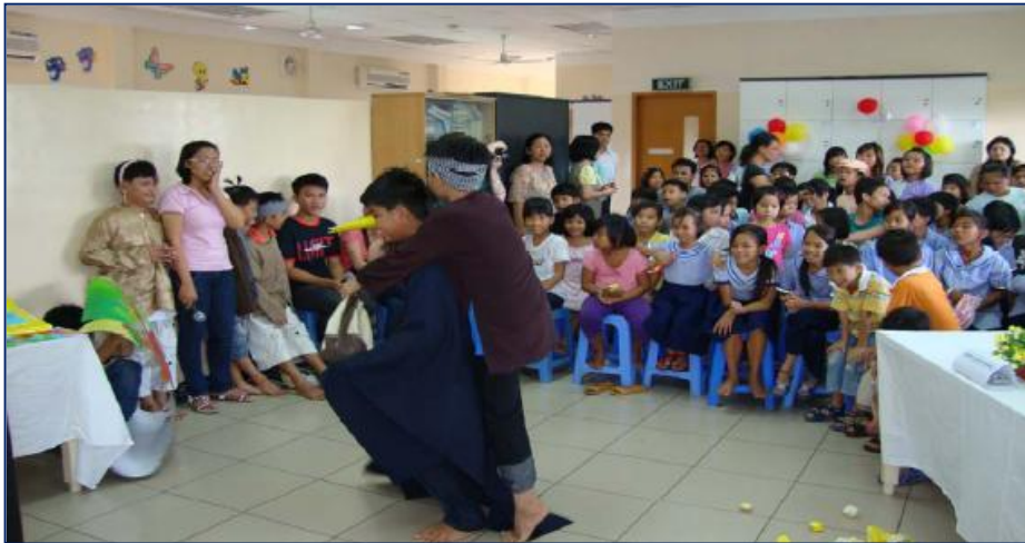
Les enfants lors d'une activité de lecture dont le thème était : Interpréter un livre par le théâtre